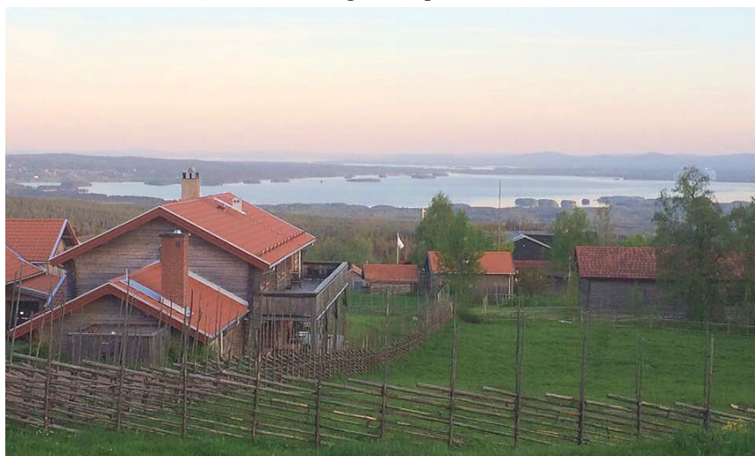
Bild till höger: Utsikt från Fryksås där skogen tar vid vid fåbodens gräns, och Orsasjön blänker i dalen. Bebyggelsen har till största delen tydliga gårdsbildningar och låga hus med trägrå omålade fasader.

Bebyggelse som avviker från denna karaktär finns men ska inte vara normgivande för nytillkommande bebyggelse. Takkupor och höga grunder ska anses avvikande, liksom stora glasade partier i fasaden.